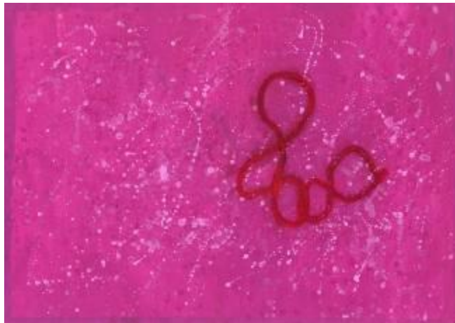
Schülerarbeit: Malerische Reaktion auf Materialimpulse