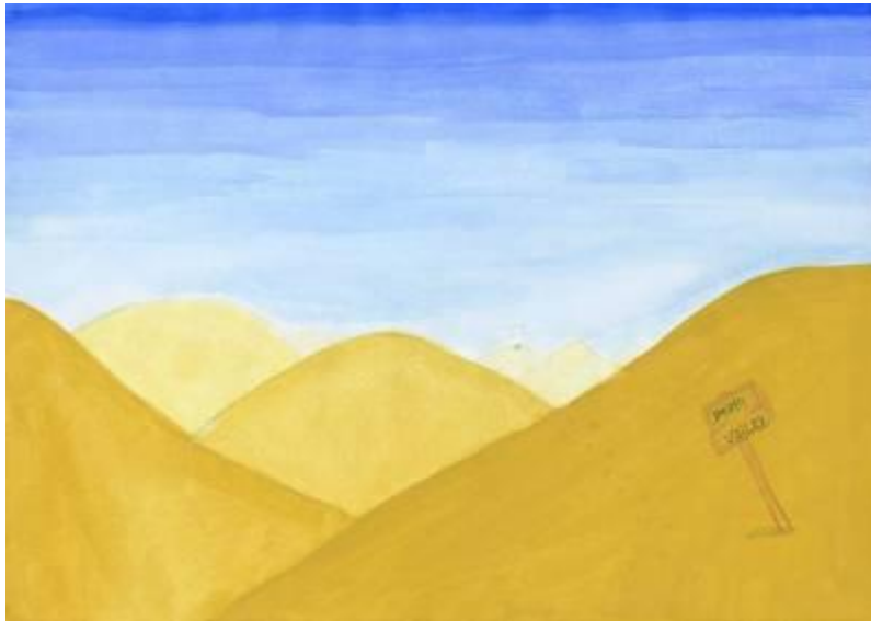
Schülerarbeit: Raumtiefe durch Aufhellung von Farben