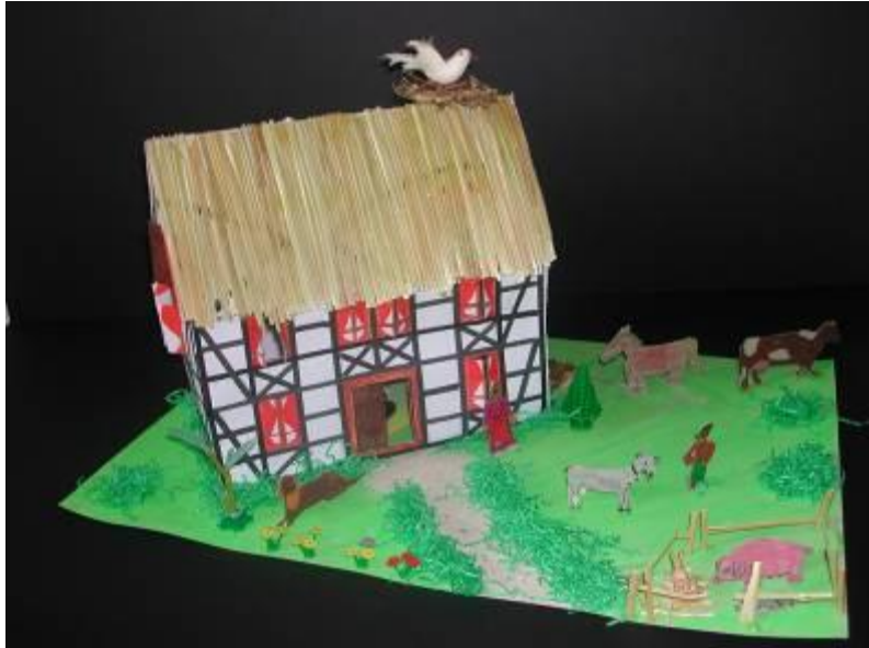
Schülerarbeit: Der Traum vom Landleben