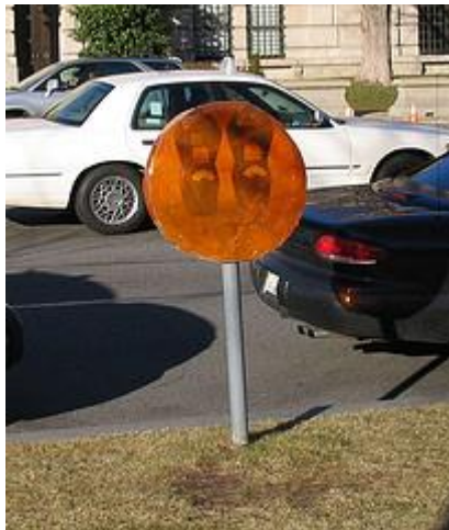
Mark Jenkins Installation "meterpops"