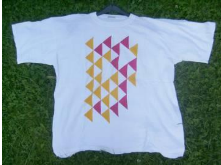
Schülerarbeit: gestaltetes T-Shirt