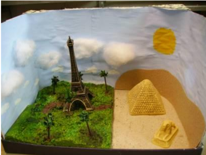
Schülerarbeit: Zwei Miniaturwelten in einem Schuhkarton