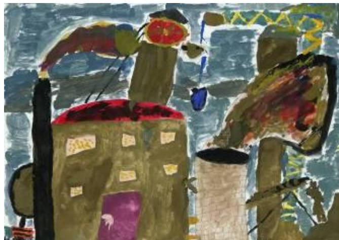
Schülerarbeit: Industrielandchaft in getrübbten Farben

Orte für Präsentationen untereinander abstimmen