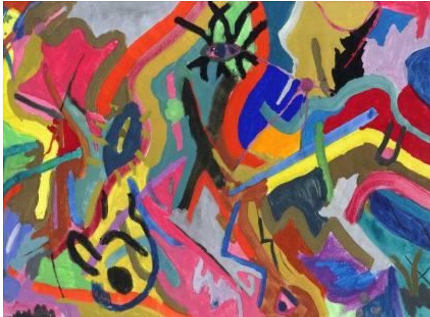
Schülerarbeit: expressive Abstraktion