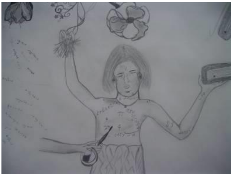
Schülerarbeit: Meine Bildwelt zwischen Naturwissenschaften und Lesen (Ausschnitt)